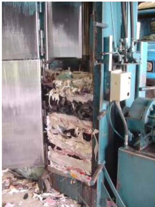
Figura 2 - Prensa de 42 toneladas utilizada para redução do volume dos resíduos industriais.

Esse procedimento é fundamental na otimização do uso do espaço, sendo adequadamente utilizado pelo processo de empilhamento geométrico com ponte rolante, que potencializa os resultados favoráveis obtidos com o tratamento por prensagem.