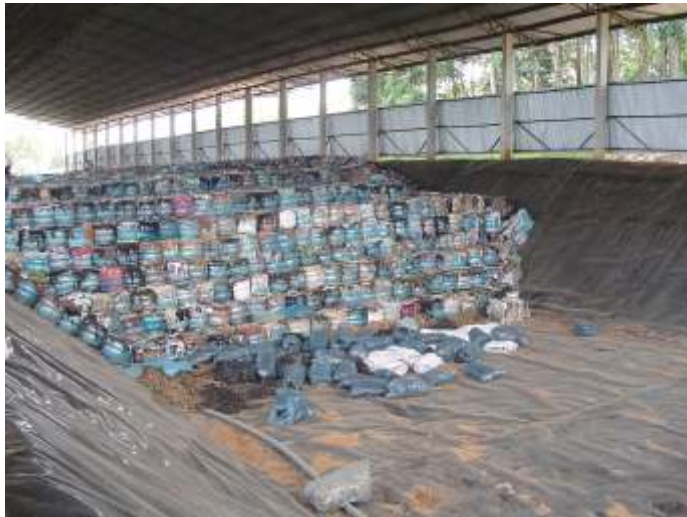
Figura 6 - Vala atualmente em uso, mostrando o perfeito empilhamento utilizado para otimização dos espaços.

Na Figura 6, observa-se uma vala em operação, com restos de resíduos soltos para servirem de lastro para o empilhamento geométrico dos fardos.