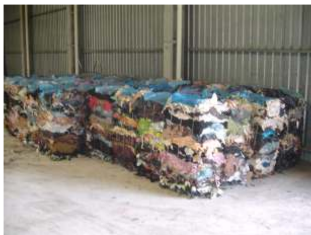
Figura 4 - Material prensado e armazenado para transporte e disposição final em valas.