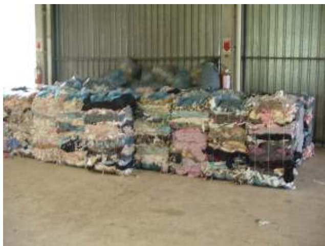
Figura 3 - Material prensado em prensa hidráulica para redução da utilização do espaço nas valas, otimizando custos, permitindo destinação final adequada e futuro reaproveitamento, quando houver tecnologias economicamente viáveis.

Na Figura 3, é apresentado o resultado do processo de prensagem ou enfardamento e, na Figura 4, logo abaixo, depósito para colocação dos fardos enquanto não são destinados para as valas.