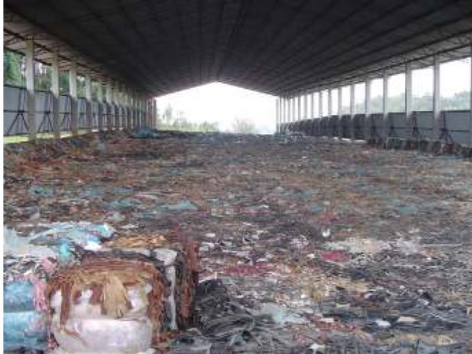
Figura 5 - Vala de disposição final dos fardos que são empilhados geometricamente, para plena utilização dos espaços, otimização de custos e possibilitando reaproveitamento futuro.

Na Figura 5, é mostrada uma vala já preenchida, que deverá receber mais 2 ou 3 andares de fardos e ser encerrada com manta de Polietileno de Alta Densidade (PEAD) com 2 mm de espessura. Enquanto está em operação, a vala tem cobertura para impedir o acesso das águas pluviais, produzindo chorume e danificando os materiais, procedimento reforçado pelos sistemas de proteção lateral contra as águas pluviais.