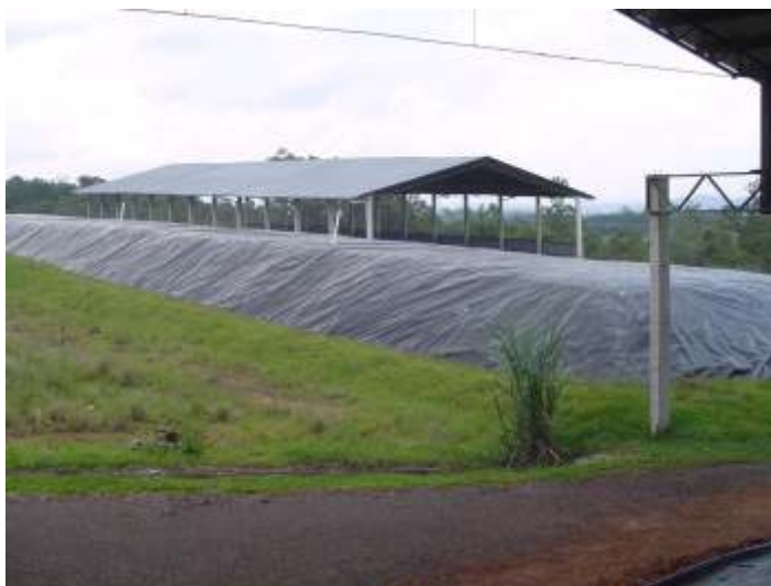
Figura 7 - Vala encerrada com proteção de geomembrana de Polietileno de Alta Densidade (PEAD), contra intempéries, sem a necessidade de cobertura e aguardando cobertura com argila de baixa permeabilidade ou reaproveitamento.

Na Figura 7, observa-se uma vala totalmente preenchida e já encerrada. Nessa fase, não é mais necessária a presença de cobertura para impedir o acesso das águas da chuva, pois a própria manta de Polietileno executa essa função. Os telhados então são removidos para utilização em novas valas.