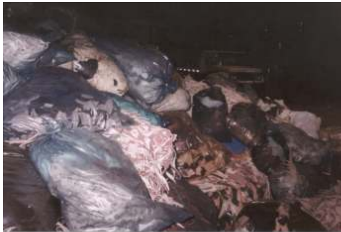
Figura 1 - Material recepcionado, segregado em sacos plásticos.

Os sacos plásticos contendo resíduos diversos são abertos e despejados no interior da prensa hidráulica para redução de volume.