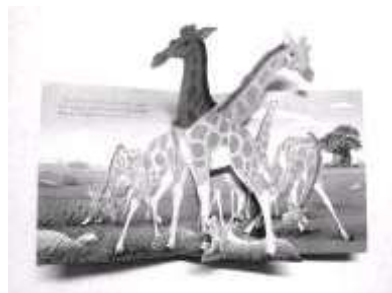
Fig. 4: Páginas internas do livro infantil "Onde está Simba?" da Disney-Melhoramentos. Nos livros pop-ups tem influência do origami. Devido às dobras e o tipo de colagem, as figuras parecem saltar da página.