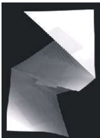
Fig. 15 Folder do Indac (Instituto Nacional para o Desenvolvimento do Acrílico). Aberto, o papel é retangular, mas as dobras diagonais formam uma abertura interessante.