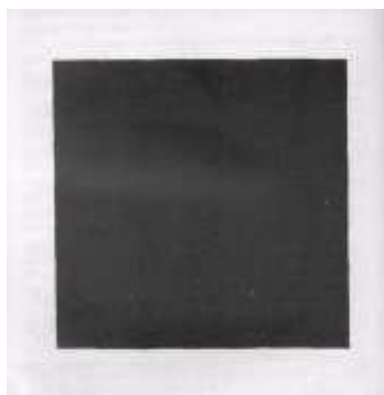
Fig. 8 (GULLAR, 1999, pág. 138): Quadrado preto sobre fundo branco (1913) de Kasimir Malevitch.