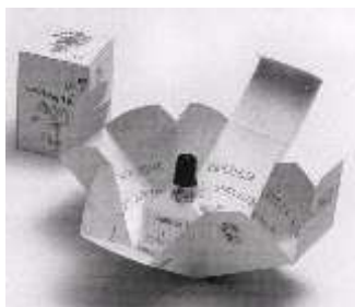
Fig. 14 (V BIENAL DO DESIGN GRÁFICO, 2000, pág. 166) Embalagem de perfume Contém 1g, desenvolvido pela House Agency Contém 1g. As embalagens são exemplos de origami unido a tecnologia.

do indivíduo... está baseada no conceito de 'experiência estética' hoje vigente, em oposição a atitude mais passiva do receptor no passado, quando a percepção da obra se dava apenas através da assimilação de sua narrativa expressa prioritariamente no plano bidimensional 26 .