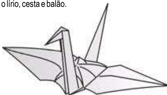
Fig. 1 (disponível no site www.moderna.com.br/arte/origami/ ): O tsuru , grou ou cegonha, que é o origami símbolo do Japão

Entre 1338 e 1573, período Muramachi, o papel deixou de ser tão caro e a arte de dobrar se estendeu a um número maior de pessoas. Os japoneses faziam a transmissão das formas de origami através da tradição oral. O ensino das figuras era passado de pais para filhos. Contudo, sem o registro das formas através de desenhos ou escrita, apenas as mais simples dobras eram mantidas através do tempo e das gerações. Muito do que conhecemos de origami atualmente deve-se ao período Edo (1603-1867), pois em 1797 surgiu a primeira instrução escrita de origami, quando houve a publicação de um livro intitulado Senbazuru Orikata 4 . Posteriormente, em 1845 foi publicado o livro Kan No Mado 5 , reunindo uma ampla coleção de figuras tradicionais do Japão. Nessa fase, o origami tornou-se ainda mais popular e passou a ser praticado por mulheres e crianças, independente da classe social. Até o final da Era Edo, foram criados aproximadamente setenta tipos de origami, entre eles os tradicionais tsuru 6 (Fig. 1), sapo, o lírio, cesta e balão.