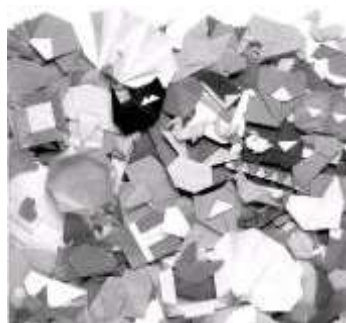
Fig. 2 (KITAMURA, 1991, capa) : Diversos tipos de origami figurativo, a maioria utilizando a técnica tradicional.

Na Era Meiji (1868-1912) o origami foi incluído no programa escolar, após sofrer grandes influências do método de origami alemão. Isto porque, assim como o origami floresceu no Japão, na Europa ele também ficou conhecido. Os origamis de origem ocidental, no entanto, apresentam formas geométricas como característica predominante, diferente dos origamis japoneses que sempre foram mais figurativos (Fig. 2) imitando formas de animais, pessoas, flores, entre outros.