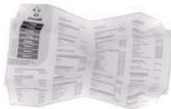
Fig. 13: O conteúdo texto interno é simples (localização, nome e telefones das lojas), mas as dobras internas surpreendem.