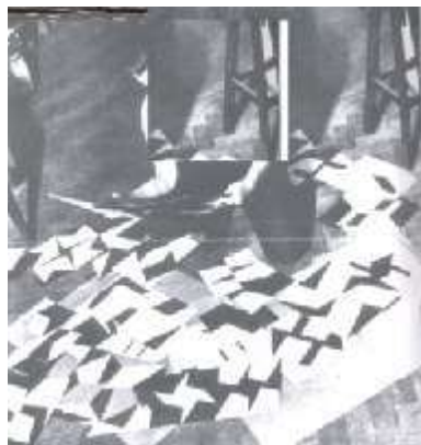
Fig. 10 (GULLAR, 1999, pág. 268): O formato manipulado na composição das figuras fez com que esses quadros de Lygia Clark se assemelham às dobras básicas de origami.