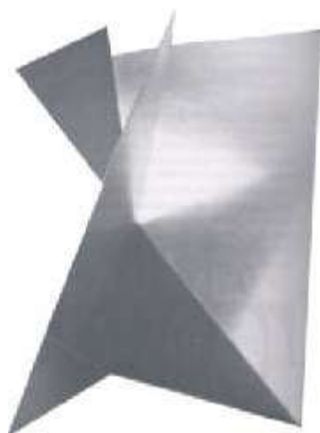
Fig. 9 (GULLAR, 1999, pág. 258): Lygia Clark, Bicho (1960).

publicitárias gráficas não convencionais que utilizam apelos tridimensionais e sensoriais também estabelecem esta relação com o indivíduo consumidor, porém, na linguagem publicitária, aos invés do indivíduo recriar-se através do fazer interativo ele aceita participar do “jogo” publicitário seduzido pelas características inovadoras destas peças” 18 .