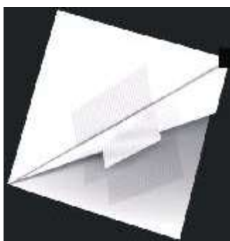
Fig. 16 Fechado, o folder fica quadrado.