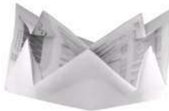
Fig. 12: Parte interna do "Guia de Compras".