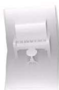
Fig. 5: Cartão da Origami Arquitetura de Papéis

É interessante observar, historicamente, como o desenvolvimento das artes de impressão no Oriente surgiu com as mesmas motivações verificadas no desenvolvimento do origami. Como artes de impressão têm-se as famosas gravuras japonesas que influenciaram