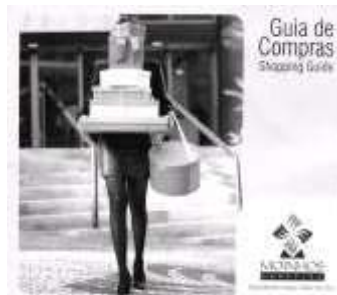
Fig. 11: Capa do "Guia de Compras" do Moinhos Shopping. A capa "convencional" não revela as dobras internas

Dessa forma, o origami é um recurso que pode ser aplicado com o objetivo de valorizar uma peça gráfica. Dobras diferenciadas podem ser a quebra do paradigma de trabalhar apenas com o elemento texto ou com dobras que respeitam padrões. O uso do origami em algumas peças gráficas é um elemento que agrega a elas uma diferenciação, distinguindo-as do convencional (Fig. 11 e Fig. 12 e 13). Embora o origami seja uma técnica que, em muitos casos, depende de uma produção mais manual - o que dificulta o seu emprego em peças gráficas reproduzidas em larga escala - é interessante notar que o seu uso, por outro lado, pode ser também um aspecto de valorização, justamente por ter esta ligação com o trabalho e a aplicação mais manual: “Embora o trabalho publicitário tenha intenções bastante diferentes do trabalho artístico, ambos trabalham com o aspecto plástico e ambos têm interesse em causar reações no receptor. Acredito que o mesmo impacto causado por uma vanguarda artística possa ocorrer quando se rompe com os padrões convencionais na comunicação. Assim, se o receptor está acostumado às peças publicitárias convencionais, ele incorpora suas razões estéticas, e quando estes padrões são subvertidos, ele se surpreende” 19 .