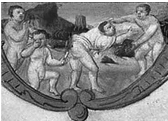
Fig. 1 – Juego escatológico: incendiarse ventosidades orgánicas Libro de las/os Niñas/os . Rouen, Iluminura, 1500.