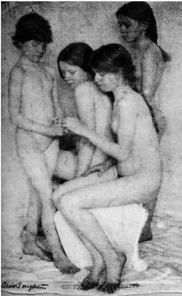
Fig. 8 – Alice Boughton Niñas/os Desnudas/os , Fotografía (1902)

de la infancia. Surgen fotografías como la de Alice Boughton (1865-1943), como Niñas/os Desnudas/os (Fig. 8):