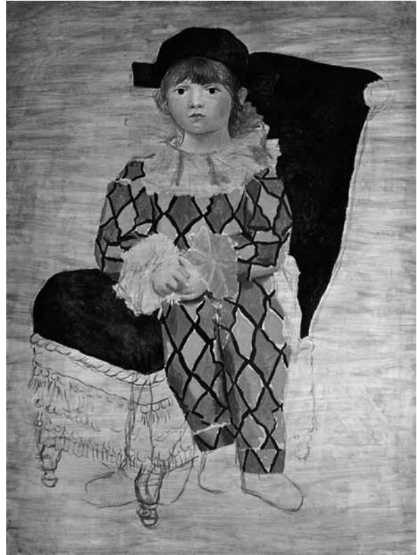
Fig. 9 – Pablo Picasso. Paul de Arlequín , Óleo/tela (1924) Fonte: Museo Nacional de Picasso

Hacia 1924, Pablo Picasso (1881-1973) pinta a su hijo Paul como un Arlequín (Fig. 9). Se trata de una pintura inacabada: