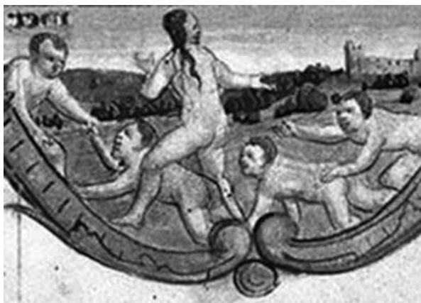
Fig. 2 – Juego de gimnasia: salto con las chicas Libro de Crianças , Rouen, Iluminura, 1500

En outra de las imágenes del mismo dossier, aparece el juego del salto (Fig. 2):