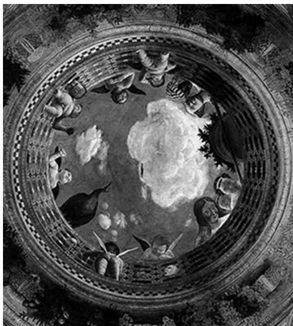
Fig. 3 – Andrea Mantegna Cámara Nupcial , Fresco (1465-74)

Un trabajo representativo de esta nueva dimensión de la infancia, pertenece a Andrea Mantegna (1431-1506) quien, pinta ilusionísticamente una arquitectura en la Cámara Nupcial (Fig. 3), en Mantua, en 1474.