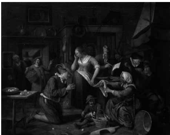
Fig. 6 – Jan Steen El contrato de matrimonio , Óleo / tela (1668)

En la pintura de Jan Steen (1626-79) (Fig. 6), podemos observar la inserción de la infancia en un contexto de subordinación. Su imagen recuerda las relaciones feudales. Está claro que únicamente es posible salir de la infancia al romperse los lazos de dependencia (ARIÈS, 1960). En este cuadro (Fig. 6),