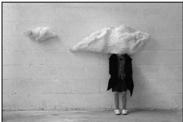
Fig. 10 – Laura Ford Instalación (2009)

no el enmurallado sistemáticamente , un nuevo órgano crítico que se dispone en nuestro contexto sensiblemente, se asoma y se impone sólido y consistente. Los afectos deberán ser otros y su carácter relacional con la cultura, llámese familia, escuela o medios de información, con seguridad también deberá cambiar, está cambiando.