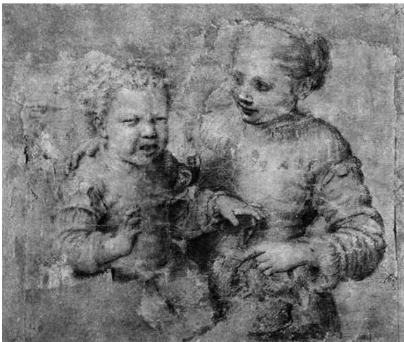
Fig. 4 – Sofosniba Anguissola Niño mordido por un cangrejo Lápiz negro y carbón / papel de estraza (1554)

Será Sofosniba Anguissola (1530-1625) quien sea una de las primeras artistas en figurar afectos en personas, precisamente en el personaje de la infancia. Es el caso del dibujo Niño mordido por un cangrejo (Fig. 4):