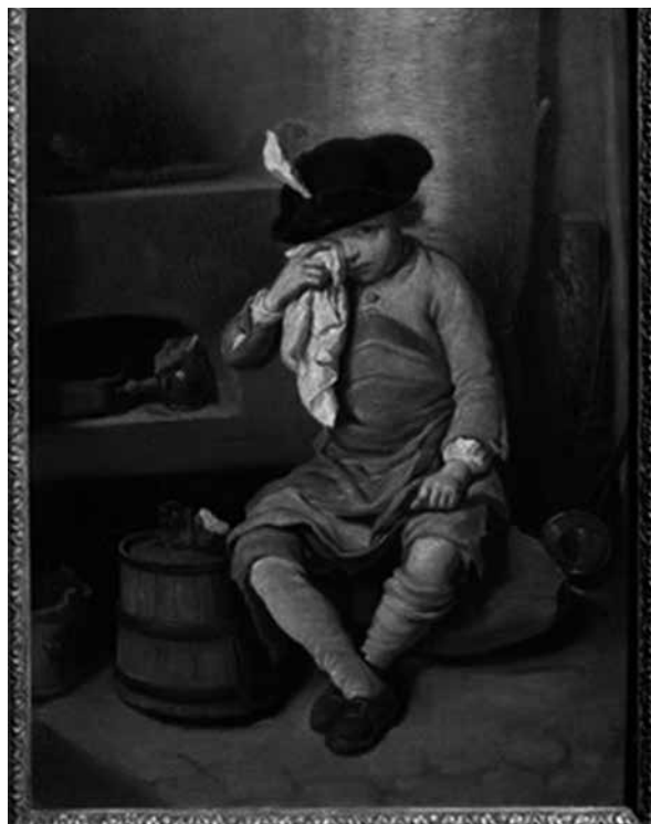
Fig. 7 – Nicolas-Bernard Lépicie El niño penitente (1781) Óleo / madera

La imagen de infancia en peligro comienza a ser practicada en el siglo XVIII, a través de la instauración de políticas y órganos administrativos y judiciales, precisamente en el momento en que se intensifican las relaciones afectivas entre padre e hijos mediante el dispositivo de la sexualidad (FOUCAULT, 1984). El pintor francés Nicolas-Bernard Lépicie (1735-84) nos presenta la infancia como un sujeto susceptible de riesgos, luego, debiendo de atención y vigilancia (Fig. 7).