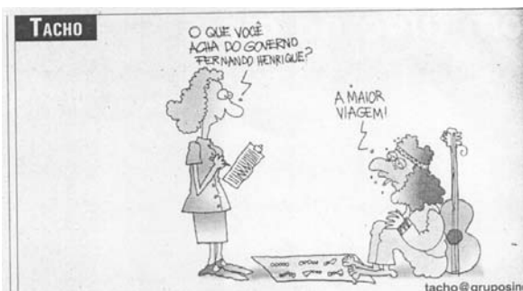
Jornal NH (25/01/2001) – p. 14

Em convergência no dia 25 de janeiro uma charge de Tacho do Jornal NH: