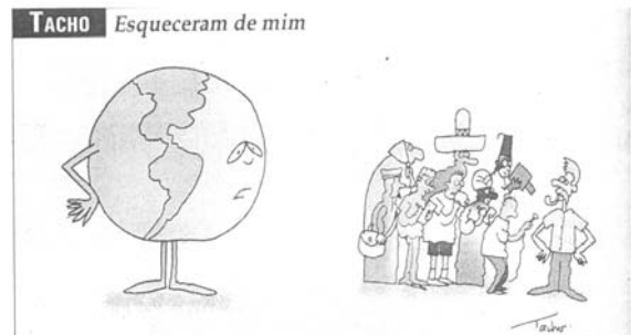
Jornal NH (31/01/2001) p 14

com destaque até o final do evento a questão ligada a José Bové. E segue mais uma charge de Tacho impressa no NH do dia 31 de janeiro de 2001.