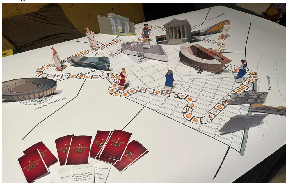
Figura 3 - Juego de roles en una ciudad romana.

En la fase de recapitulación, se analizaron las narrativas del alumnado sobre hechos históricos que aún repercuten en nuestra sociedad. Se llevó a cabo una discusión conjunta para compartir relatos y reflexionar acerca de la coeducación y la igualdad de género. El aprendizaje se enriqueció mediante el uso de estrategias dinámicas que fomentaron la participación. El alumnado debatió los roles de género previamente analizados, explorando cómo se representa a la mujer en la Historia a través de ilustraciones y textos. Esto permitió al alumnado de Educación Primaria reflexionar sobre la representación marginal de la mujer, frecuentemente asociada a entornos domésticos, en contraste con la vinculación de los hombres a espacios públicos. La figura 3 ilustra la comparación entre los estereotipos de la sociedad romana —en sus aspectos negativos y positivos— y las representaciones actuales de género.