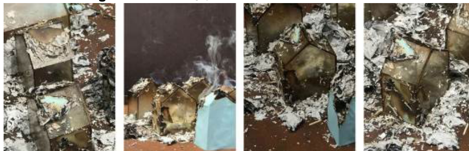
Figura 4 – . Where (is) home? María Briones Ballester