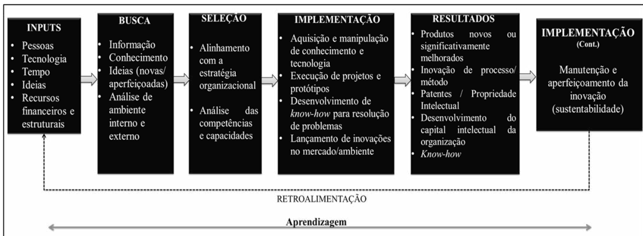
Figura 1 - O processo de inovação

Ao contrário da proposição de Tidd, Bessant e Pavitt (2008), a Figura 1 apresenta a etapa de implementação do processo de inovação partilhada, com o objetivo de alinhá-la com a etapa de resultados, incluída predominantemente com base em Trott (2012). A retroalimentação ressaltada na Figura 1, embora citada na literatura de referência, não é explicitada nas figuras originais de maneira independente (TIDD; BESSANT; PAVITT, 2008; DOSI; GRAZZI, 2009; TROTT, 2012), mas como sinônimo ou correlata à aprendizagem.