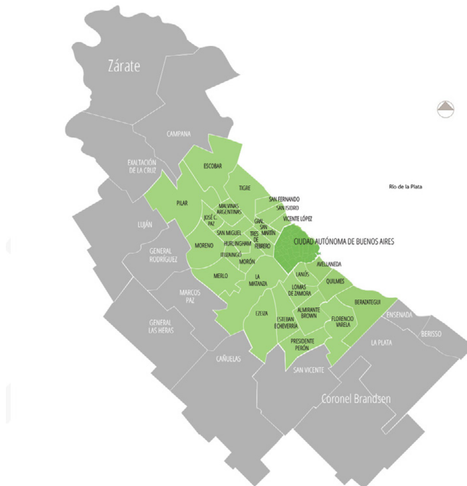
Figura 1 - Mapa del AMBA (en verde)

Los trabajadores y trabajadoras que se desempeñan laboralmente en casas particulares 7 en el AMBA han vivido durante décadas en un alto nivel de informalidad y precariedad laboral. Aún hoy la situación de informalidad subsiste a pesar de los esfuerzos llevados adelante durante los últimos años en todo el territorio nacional por las agencias gubernamentales con normativas y estrategias destinadas a integrar a estos trabajadores al ámbito de la economía formal asalariada.