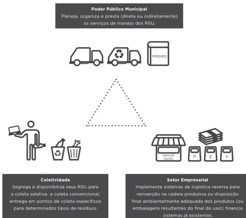
Figura 1 - Responsabilidade compartilhada