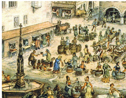
Figura 2 - Mercado medieval. Séculos XII e XIII.