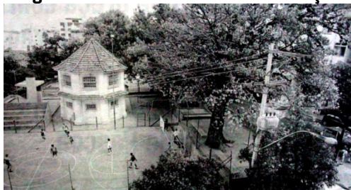
Figura 7 - Praça Gal. Osório, antiga Alto da Bronze. Início da Recreação Pública de Porto Alegre, 1926.