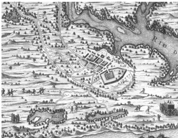
Figura 5 - Ilustração: João Pessoa-Paraíba 16 (1634).