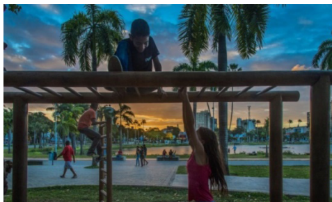
Figura 8 - Parque Solon de Lucena (Lagoa).