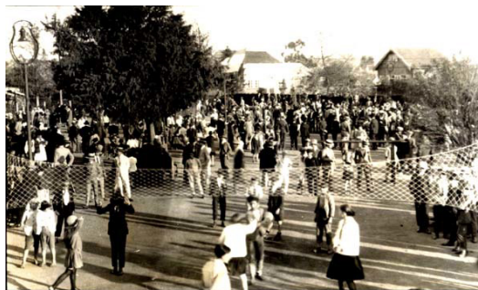
Figura 6 - “População reunida na Praça”, na década de 20, século XX. Praça Florida.