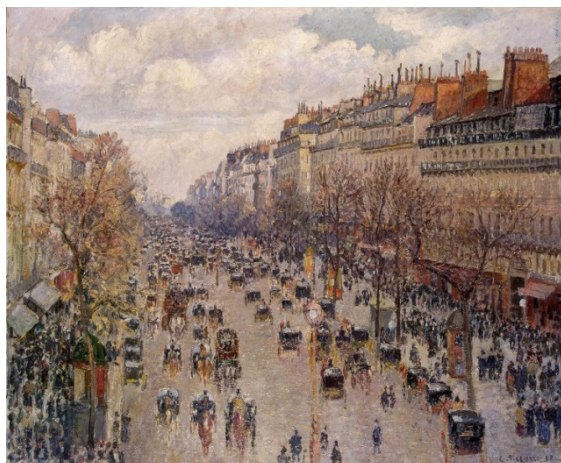
Figura 3. Boulevard Montmartre. Camille Pissarro (Pintor francês, 1830-1903).

Fonte: Arte e cidades: as pinturas de Paris. Disponível em: https://deniseludwig.blogspot.com/2014/08/arte-e-cidades-pinturas-de-paris.html . Acesso em: 08/05/2021 às 22h:35min.