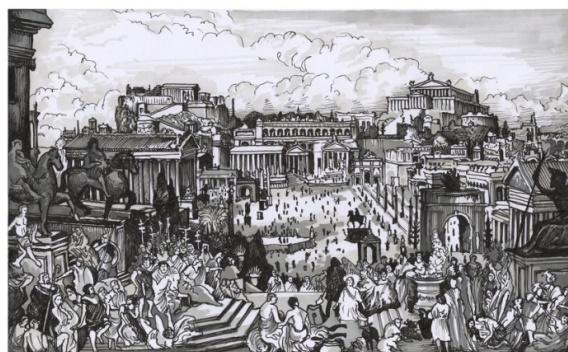
Figura 1 - Fórum romano. Pintura “O martírio de Santa Inês”. Joseph Desiré Court, 1864. Óleo sobre tela 498 x 812 cm.