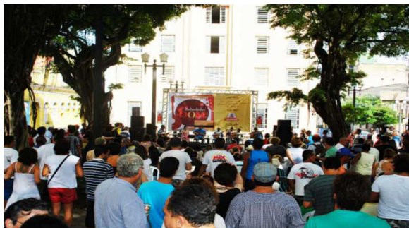
Figura 10: Clube do choro dentro da programação do Projeto Sabadinho Bom 26 , Praça Rio Branco.