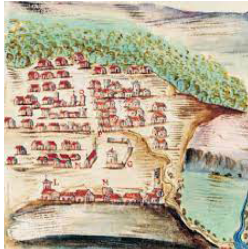
Figura 4. Gravura de João Teixeira Albernaz I.

servia de acesso ao largo formado pela Igreja Matriz (M), Convento de São Francisco (L), Mosteiro de São Bento (G) e Igreja da Misericórdia (N).