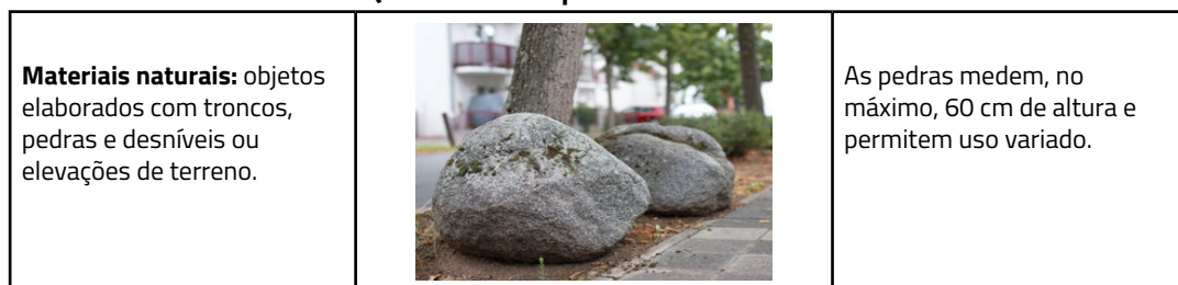
Quadro 1 - Companheiros de caminho

Segundo Meyer e Zimmermann (2020), o brincar está intrinsecamente na memória da maioria das pessoas. Mesmo com a ideia de playground muito fortemente difundida ao público infantil, os caminhos percorridos podem ofertar situações lúdicas para os seus transeuntes alterando as ruas a partir de: a) materiais naturais: pedras, troncos de árvore; b) mudanças no pavimento: campos para jogos, faixas laterais no caminho; c) objetos industriais. Não são brinquedos convencionais. Os autores denominaram de “companheiros de caminho,” 27 conforme quadro abaixo: