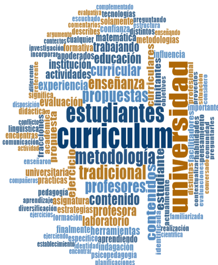
Figura 1: Aspecto curricular

Finalmente, cabe mencionar una categoría emergente relacionada a la pertenencia del profesorado a la Universidad en la cual se desempeñan como docentes.