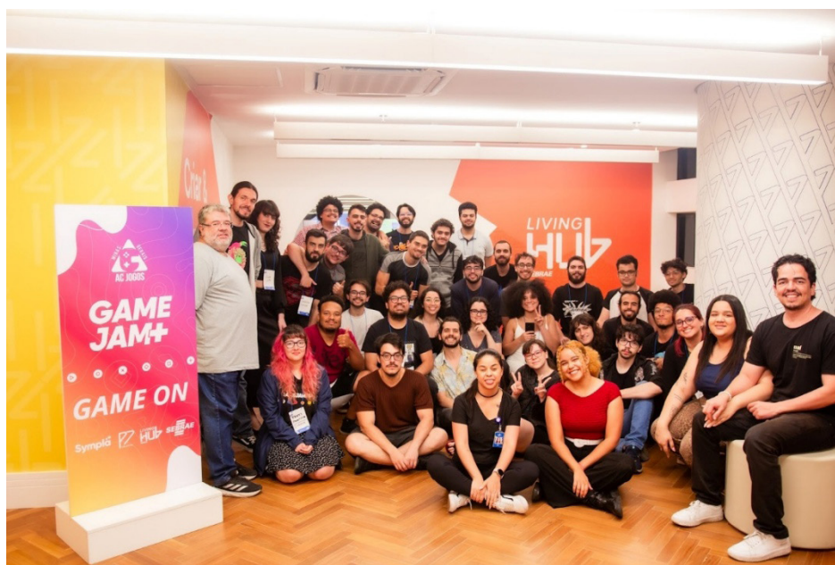
Figura 4 - Participantes da 10ª Edição da GameJamPlus - Sede Belo Horizonte

pessoas neurodivergentes e pessoas autodeclaradas negras (Fig. 4). Este demográfico se alinha também ao apontado por Lai et al, (2021) sobre jams serem “incubadores de diversidade” capazes de enfrentar a falta de representatividade na indústria de jogos. Nesta jam, apesar da presença de uma parcela alta de homens brancos cis, pode-se notar um cenário em que o ecossistema belorizontino tem tido algum êxito em suas ações de inclusão, diversidade e representatividade. Ademais esta diversidade reverberou no conteúdo e na forma em que os jogos são desenvolvidos e apresentados, em que os modos de resistência gambiarrados agregam um viés decolonial na apropriação dos objetos técnicos. Os jogos propostos na jam trazem temáticas marginalizadas, utilizando-se de ferramentas narrativas folclóricas, regionais, vivências da rua, além de trilhas e gameplay com inspirações em culturas ancestrais.