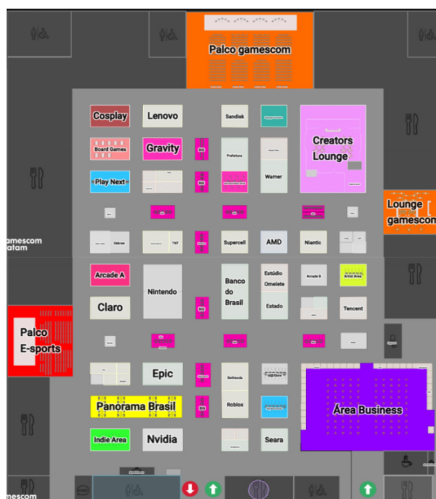
Figura 1 - Mapa Interativo da Gamescom Latam 2025. Note a presença destacada de algumas das áreas estratégicas do evento

É notável também a centralidade da produção e vivência de experiências na maneira como a organização trata o evento, bem alinhado à importância dada ao design de experiências em Getz (2011). No seu website, ao descrever as 13 áreas 2 (Fig. 1) que estruturam o evento e seu espaço, a linguagem utilizada reforça a ida à Gamescom Latam como uma experiência que agradaria a públicos dos mais diversos, seja para fins de entretenimento através do jogar e da sociabilidade; seja para fins de negócios, com oportunidades várias de networking; seja para o aprendizado e curiosidade ao aproveitar as várias palestras com profissionais e oportunidades de interação com criadores de conteúdo e outras figuras relevantes. Estes elementos se alinham às expectativas estratégicas dos eventos como locais de reforço de vínculos, formação de públicos e gerador de experiências singulares.